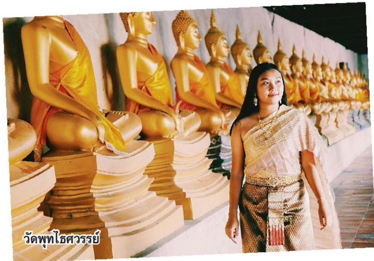
วัดพุทธไสยาสน์