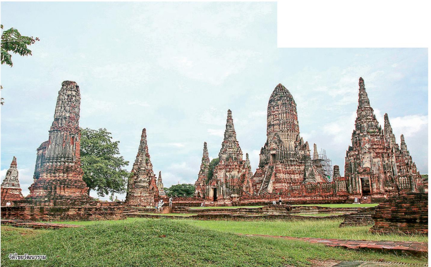
วัดไชยวัฒนาราม

ก รุงศรีอยุธยา อุดิรราชธานีไทย ไม่เคยลันมนต์ซัง แม้กาลเวลาจะลวงผ่านมานันนานถึง 400 กว่าปี แต่ก็ยังคงมีเรื่องให้ค้นหอย่างน่าสนใจ