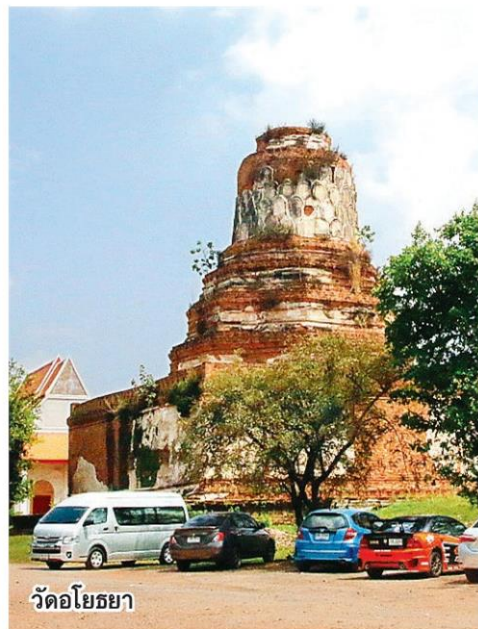
วัดอโยธยา

ที่กรุงศรีอยุธยาเจริญรุ่งเรืองถึงขีดสุด โดยเฉพาะอย่างยิ่งการค้าขายกับต่างประเทศ ความสัมพันธ์กับต่างประเทศก็ถึงขั้นส่งคณะทูตไปเจริญสัมพันธไมตรีถึงประเทศฝรั่งเศสในสมัยพระเจ้าหลุยส์ที่ 14