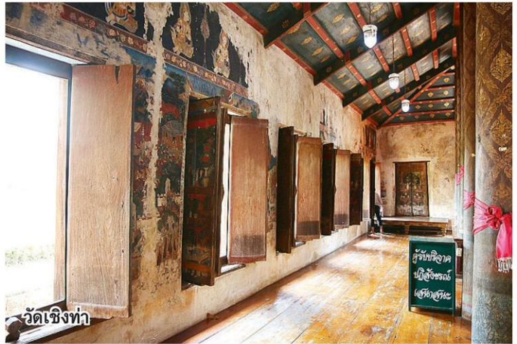
วัดเชิงท่า

เรื่องราวของละครโทรทัศน์ กล่าวถึงประวัติศาสตร์ของกรุงศรีอยุธยาช่วงแผ่นดินสมเด็จพระนารายณ์มหาราช ทรงครองราชย์เมื่อ พ.ศ.2199 ถือเป็นระยะเวลา