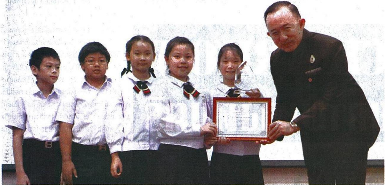
ม.ล.ปนัดดา ดิศกุล ผู้ช่วยรัฐมนตรีประจำสำนักนายกรัฐมนตรี มอบโล่และประกาศนียบัตรให้กับนักเรียนระดับชั้นประถมศึกษาปีที่ 4 โรงเรียนสาธิตกรุงเทพธนบุรี