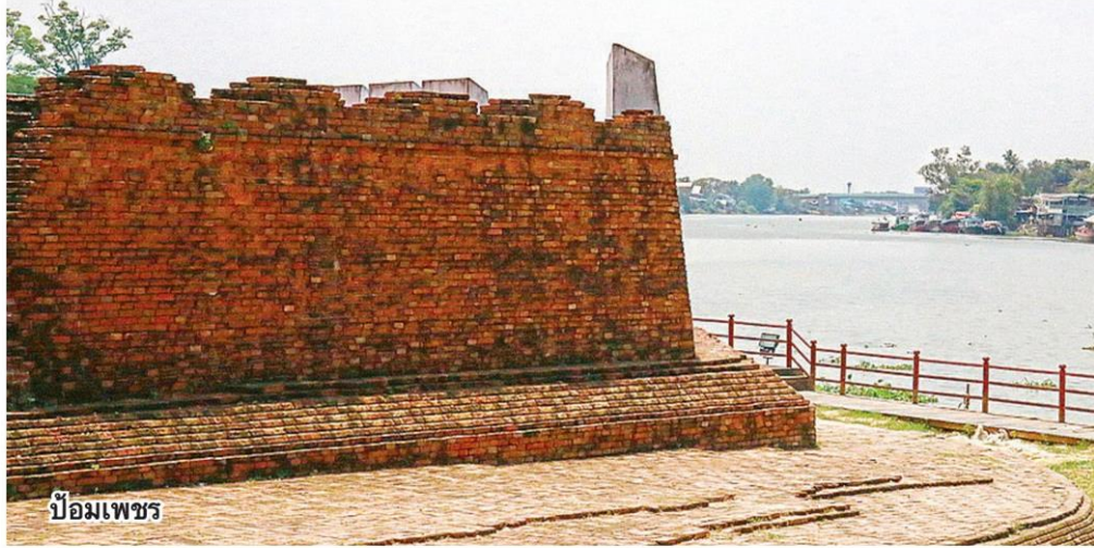
ป้อมเพชร