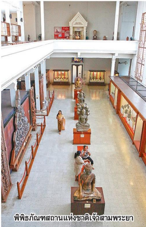
พิพิธภัณฑ์สถานแห่งชาติเจ้าสามพระยา

สามารถพัฒนาเป็นชุมชนเมืองที่มีประชากรเข้ามาอยู่อาศัยอย่างมากมาย รวมถึงชาวต่างชาติที่มีทั้งฝรั่งเศส อังกฤษ โปรตุเกส ฮอลันดา แชก จีน ญี่ปุ่น อิหร่าน ฯลฯ ปัจจุบันเหล่านี้ทำให้กรุงศรีอยุธยาสิ่งสมอารยธรรมอย่างต่อเนื่องและอยู่มาอย่างยาวนาน นำไปสู่การบอกเล่าอดีตแก่คนรุ่นหลัง เกิดเรื่องราวอันน่าสนใจมากมาย ทั้งหลายทั้งปวงแปรสภาพออกมาเป็นบทประพันธ์