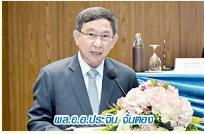
พล.อ.ประจักษ์ อินตอง

สสช. กล่าวว่า ที่ผ่านมา สสช.มีโครงการจัดเก็บข้อมูลสำคัญมากมาย อาทิ การสำรวจข้อมูลผู้มีรายได้น้อย การสำรวจสร้างความรับรู้การใช้จ่ายเงินต้นประชากร ซึ่งปัจจุบันสร้างการรับรู้ไปแล้วกว่า 1 แสนราย