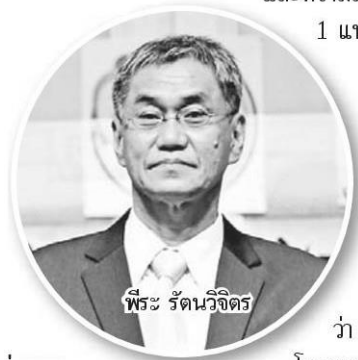
พระ รัตนวิจิตร

ขณะนี้มียุทธศาสตร์ที่เข้าร่วมทั้งหมด 42 แห่ง รวม 140 คน ประกอบด้วย ผู้บริหาร 42 คน ครูปฐมวัย 84 คน และคณะทำงาน 14 คน แบ่งเป็น สังกัด สพฐ. 18 แห่ง, สังกัดองค์กรปกครองส่วนท้องถิ่น (อปท.) 19 แห่ง, สังกัดสำนักงานคณะกรรมการส่งเสริมการศึกษาเอกชน (สช.) 4 แห่ง, สังกัดสำนักงานคณะกรรมการการอุดมศึกษา (สกอ.) 2 แห่ง และ สังกัดกระทรวงพัฒนาสังคมและความมั่นคงของมนุษย์ (พม.) 1 แห่ง